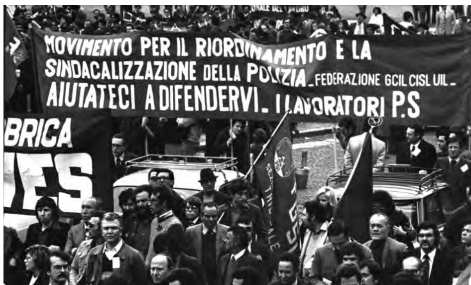
Manifestazione per il riordinamento e la sindacalizzazione della Polizia, Roma, s.d.