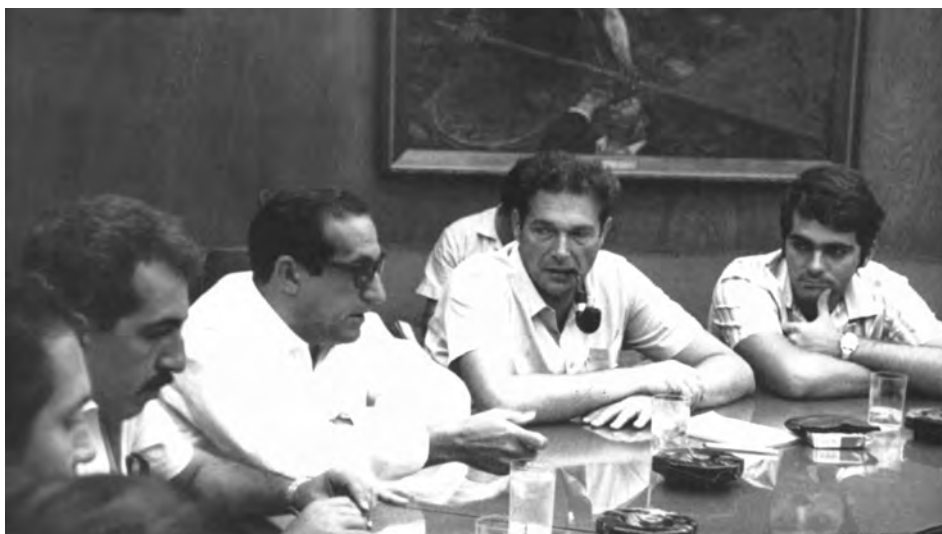
Delegazione della Cgil a Cuba, ott. 1971