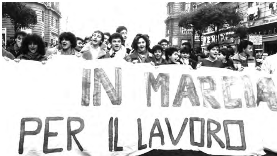
Corteo di studenti a Napoli, 10 dic. 1985