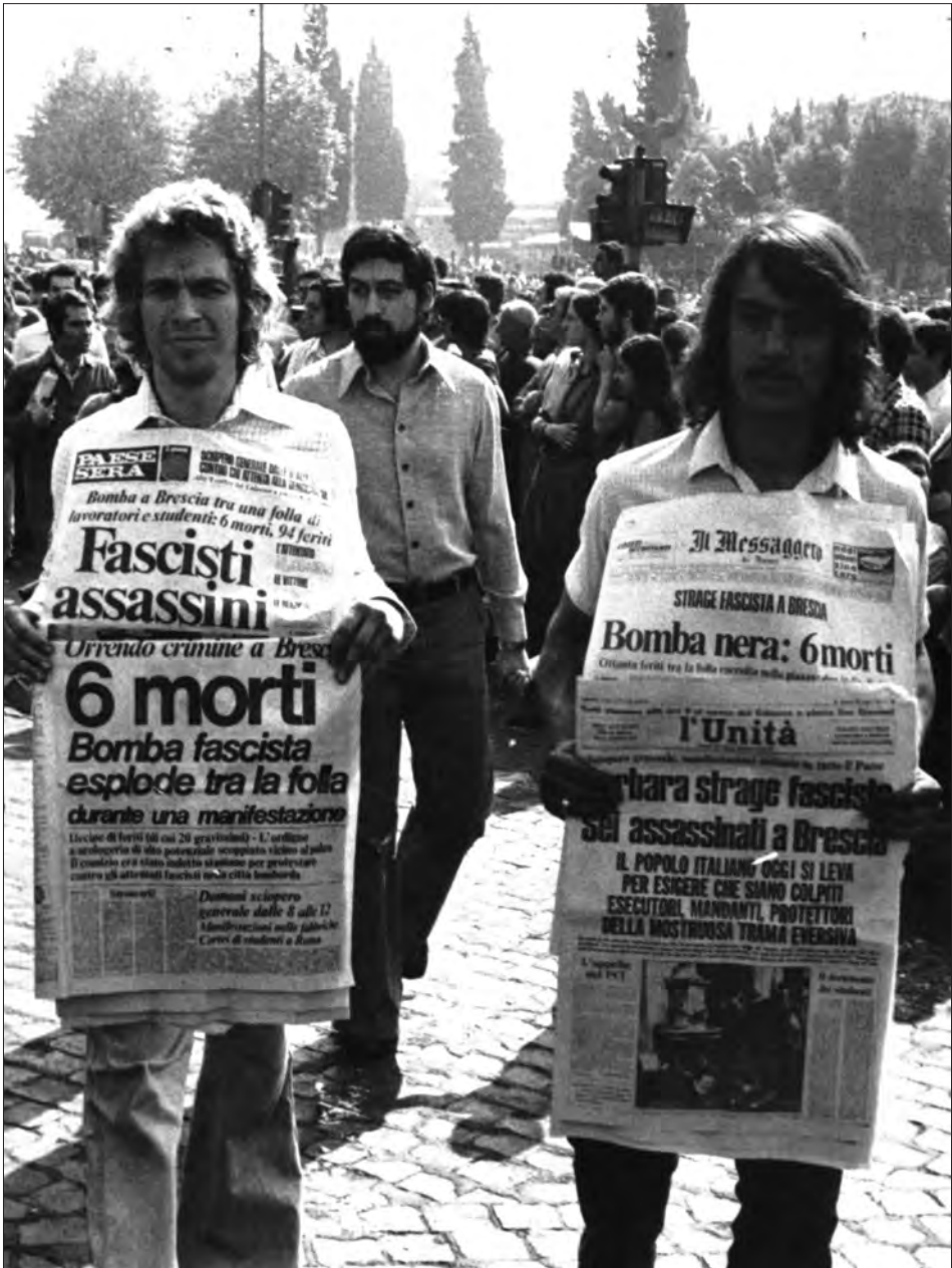
Sciopero generale contro la strage di Piazza della Loggia, Roma, 29 mag. 1974