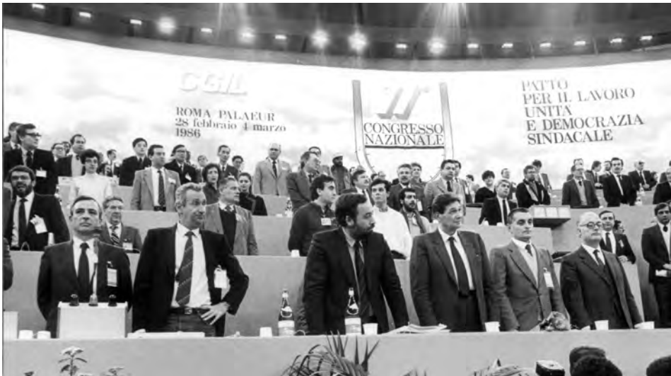
La tribuna della Presidenza. XI Congresso, Roma, 24 feb. - 8 mar. 1986