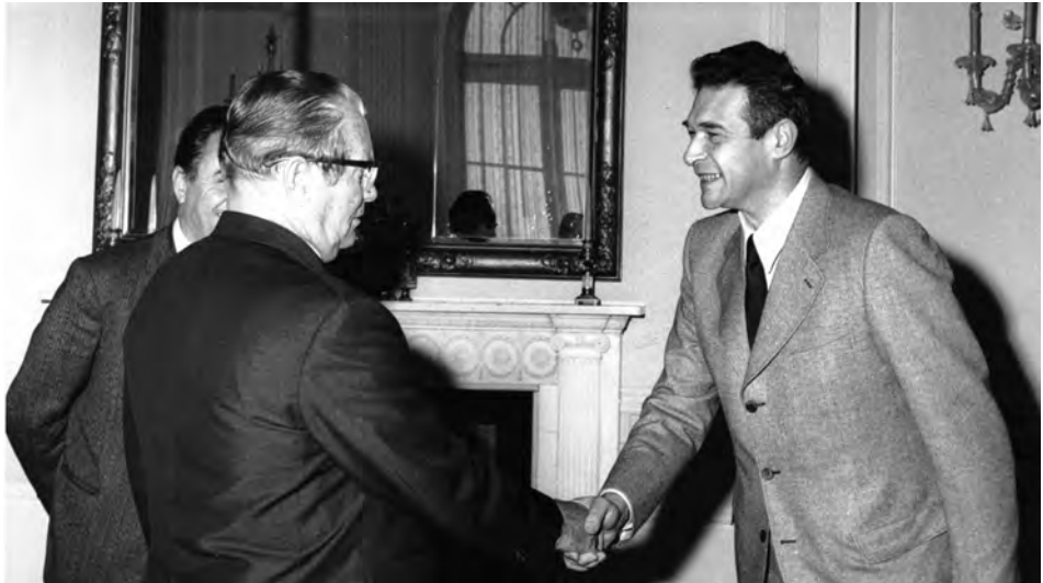
Lama stringe la mano al presidente jugoslavo Tito durante un incontro ufficiale, s.d.