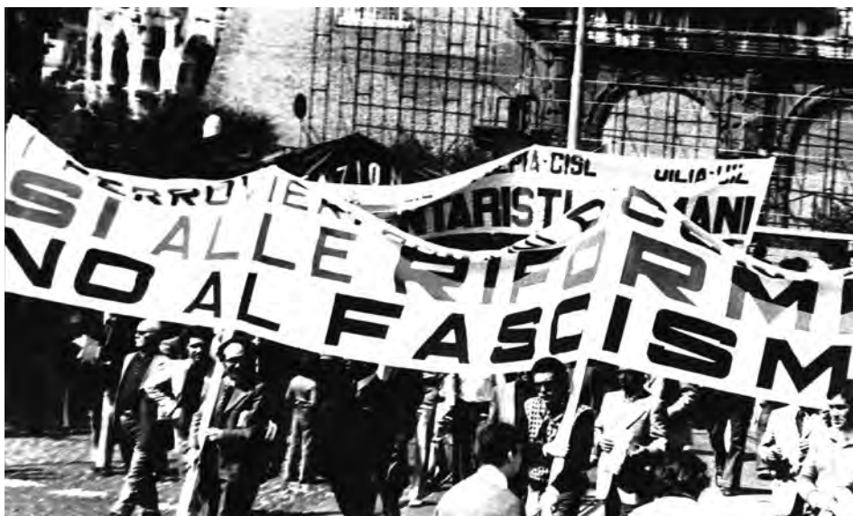
Sciopero generale, Roma, 12 gen. 1973