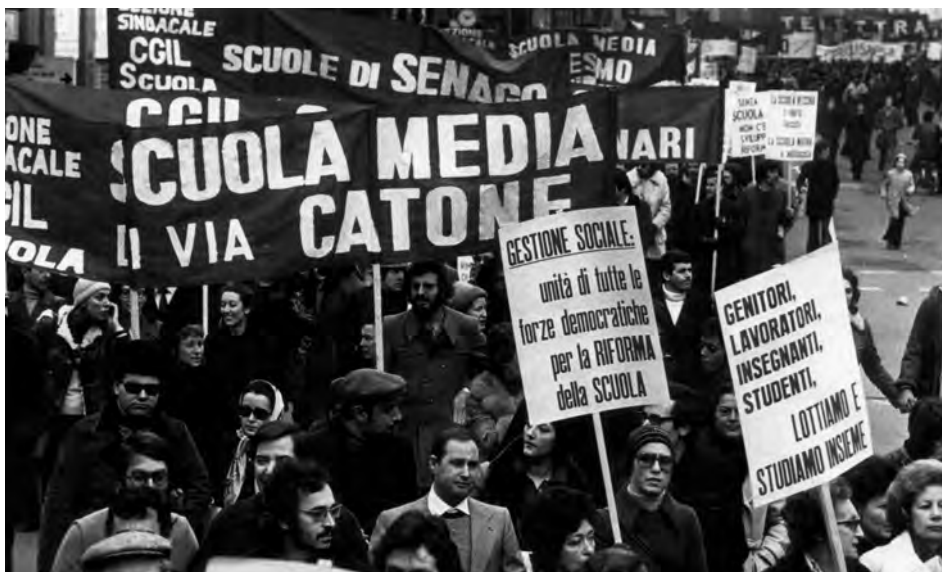
Sciopero generale degli insegnanti, Milano, 7 feb. 1974