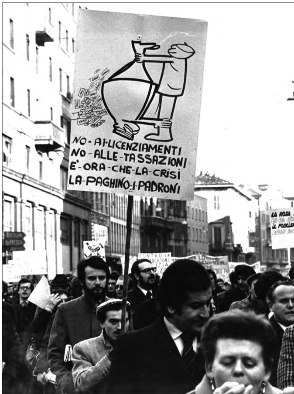
Sciopero generale, Milano, 27 feb. 1974