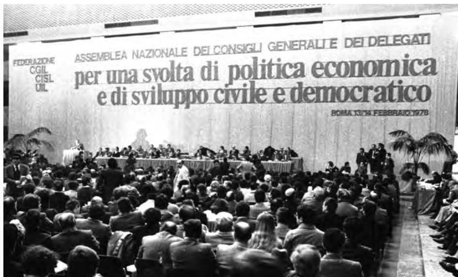
Assemblea nazionale dei Consigli generali e dei delegati, Roma, 13-14 feb. 1978