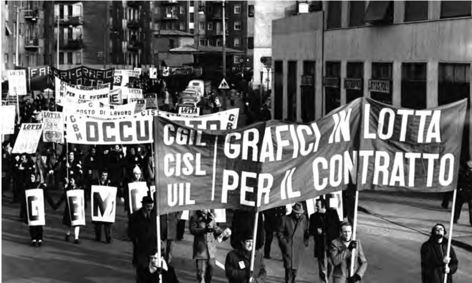
Manifestazione per il nuovo contratto di lavoro, Milano 1972