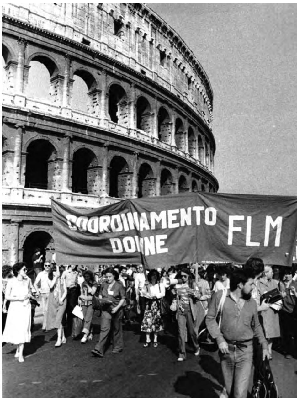
Lavoratrici metalmeccaniche in corteo, Roma 1979