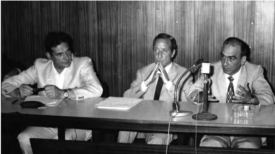
Conferenza stampa unitaria di Lama, Storti e Ravenna, Roma, 4 lug. 1970