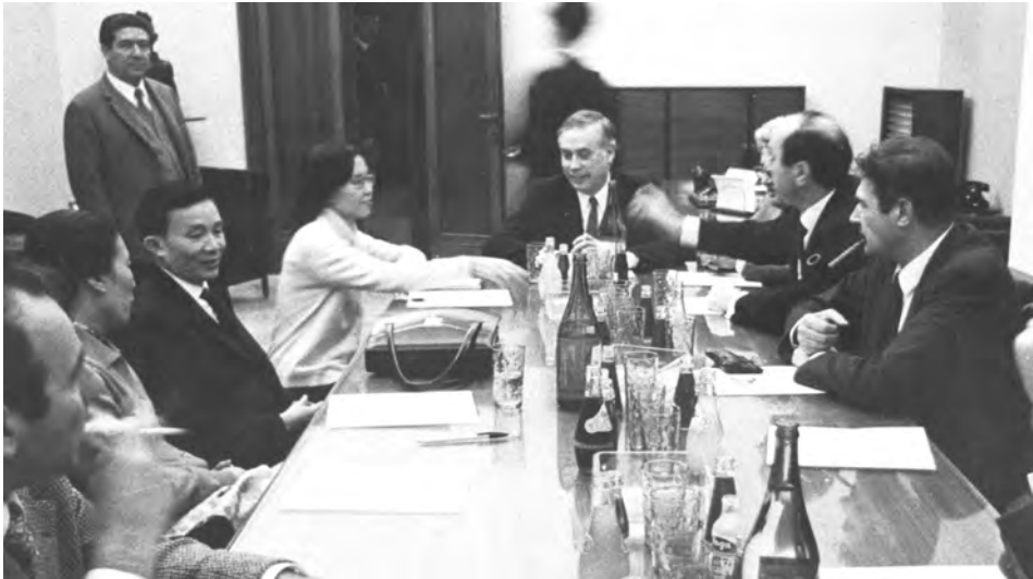
Riunione tra la Segreteria della Cgil e la delegazione del governo provvisorio del Vietnam del Sud, presieduta dal ministro degli esteri Nguyen Thu Binh, 23 feb. 1971