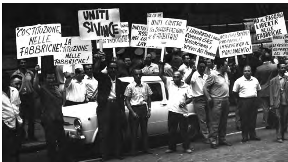
Gasisti manifestano in Via Barberini, Roma, s.d.