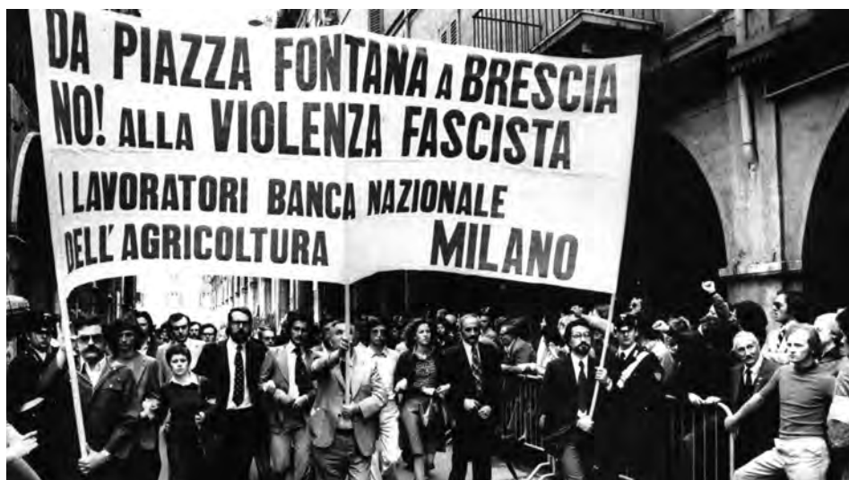
Manifestazione in occasione dei funerali delle vittime della strage, Brescia, 31 mag. 1974