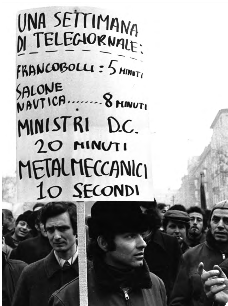
Metalmeccanico regge cartello di protesta, Milano, 15 dic. 1972