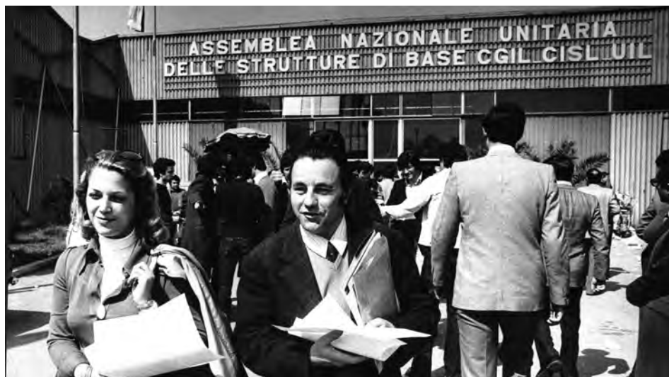
Delegati all'uscita dall'Assemblea nazionale unitaria delle strutture di base Cgil-Cisl-Uil, Rimini 6-7 apr. 1974