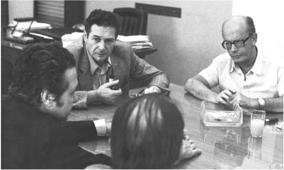
Riunione alla sede nazionale della Cgil con il primo ministro del Portogallo Mario Soares, 1976