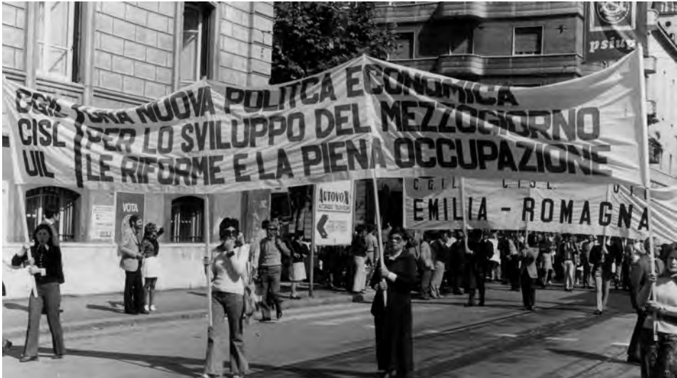
Manifestanti in corteo, Roma, 30 mag. 1971