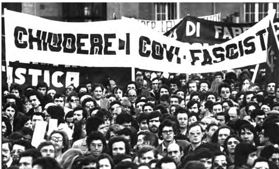
Manifestazione antifascista, Roma, 18 apr. 1975