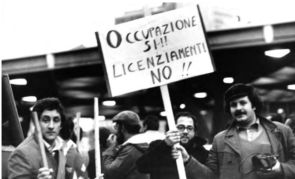
Sciopero nazionale dei metalmeccanici per l'occupazione e il rinnovo contrattuale, Napoli, 12 dic. 1975