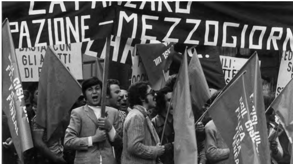
Manifestazione dei 150.000: corteo in via Nazionale, Roma, 30 mag. 1971