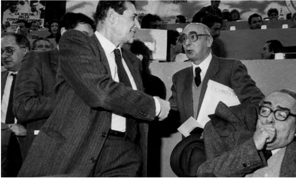
Lama, Napolitano, Foa. XI Congresso, Roma, 24 feb. - 8 mar. 1986