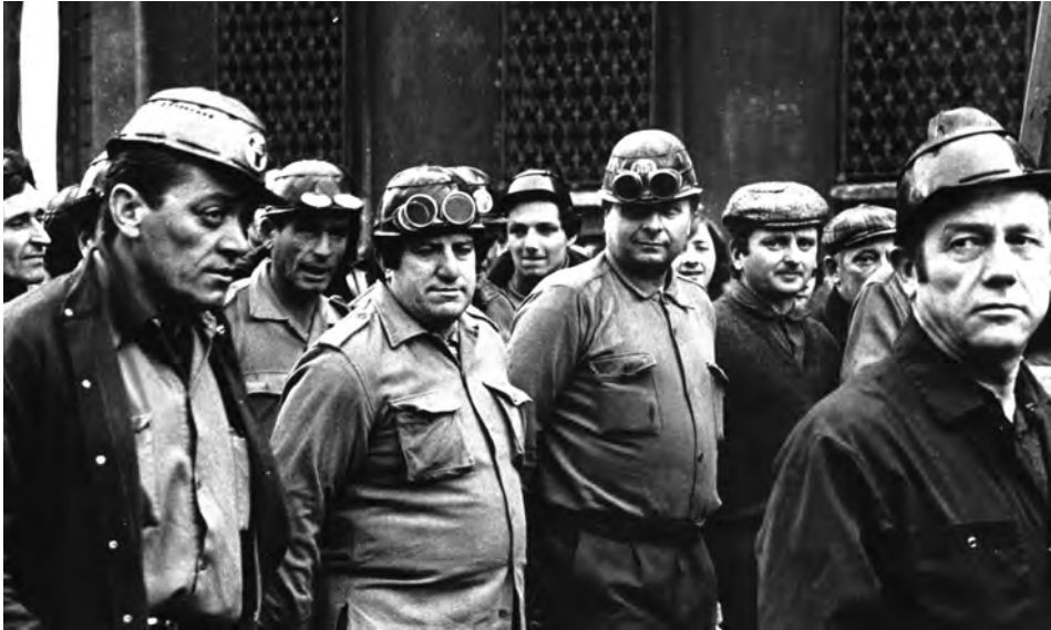
Sciopero generale, Milano, 23 gen. 1975