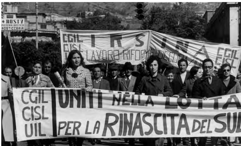
Manifestazione antifascista, Reggio Calabria, 22 ott. 1972