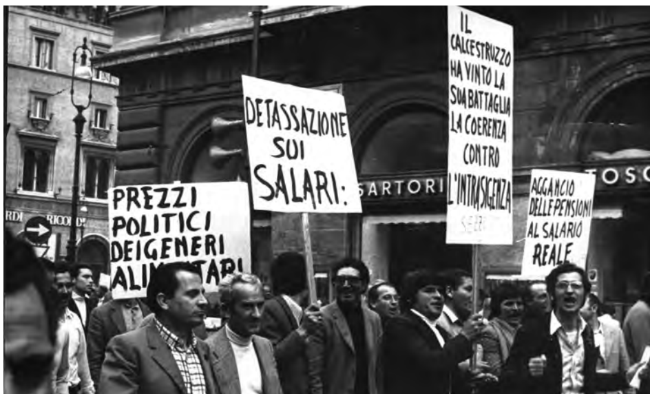
Manifestazione degli edili a Roma, 1974