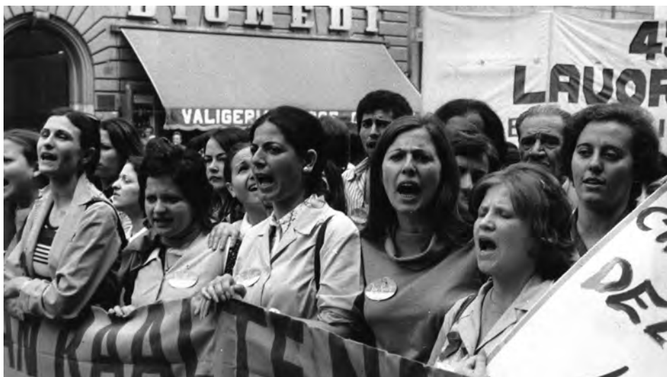
Manifestazione degli operai tessili e dell'abbigliamento a Roma: un aspetto del corteo davanti la sede del Ministero del bilancio, Roma, mag. 1972