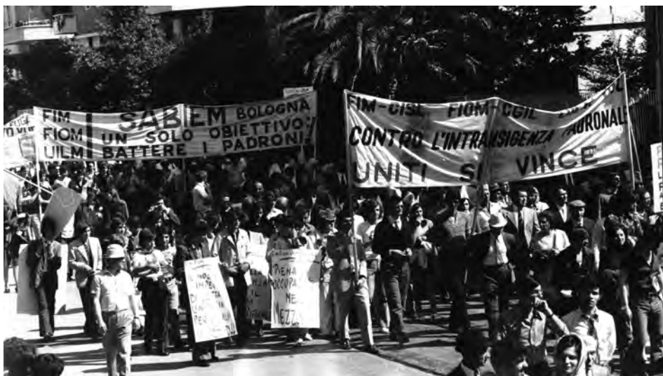
Manifestazione unitaria per l'occupazione nel Mezzogiorno, s.d.