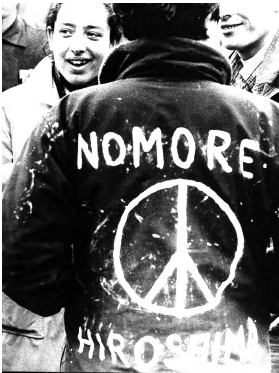
Ritratto di giovani pacifisti, s.d.