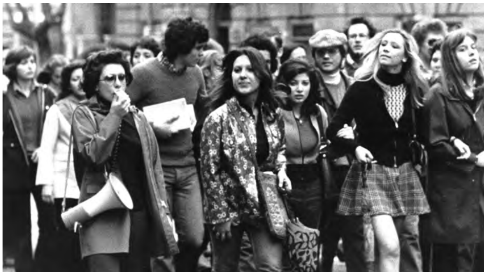
Manifestazione, ott. 1974