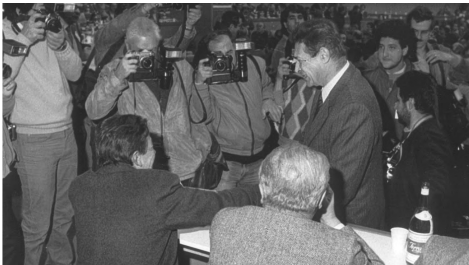
Lama saluta Berlinguer ripreso di spalle. X Congresso, Roma, 16-21 nov. 1981