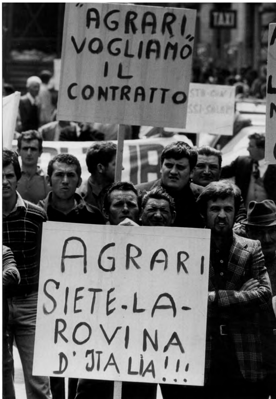
Manifestanti con cartelli, Roma 1974