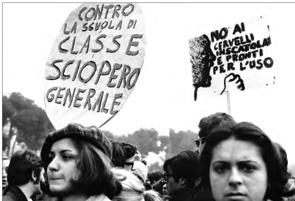
Studentesse manifestano a La Sapienza, Roma, s.d.