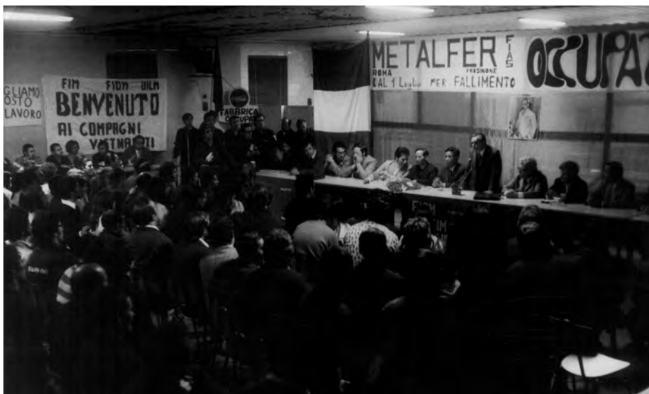
Delegazione della Repubblica Democratica del Vietnam in visita alla fabbrica Metalfer occupata, 20 ott. 1971