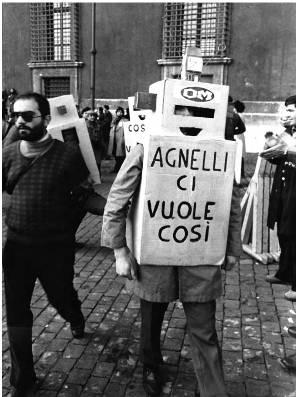
Un lavoratore della Om travestito da robot partecipa alla manifestazione nazionale dei metalmeccanici a Roma, 9 feb. 1973