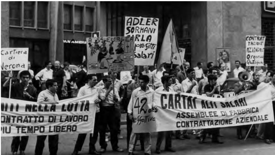
Manifestazione dei tipografi, Roma, 1975