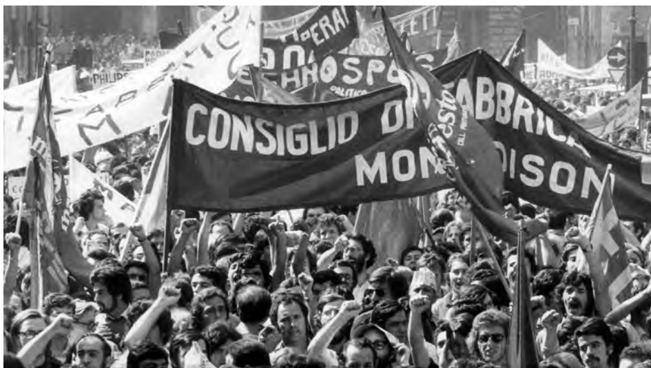
Manifestanti con striscioni, Roma 1974