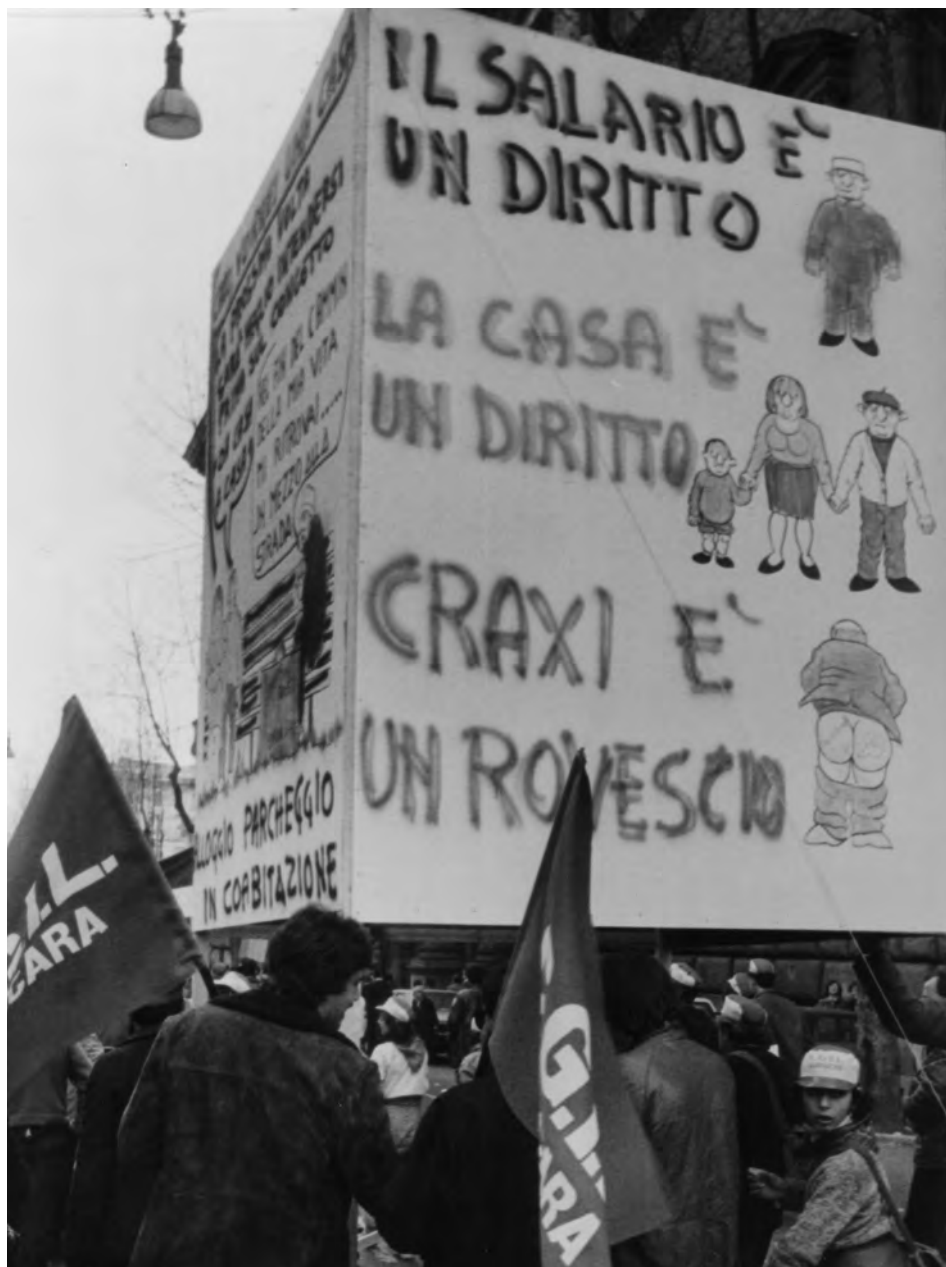
Manifestazione nazionale contro il decreto sulla scala mobile. Manifestanti in Piazza S. Giovanni durante il comizio di Lama, Roma, 24 mar. 1984