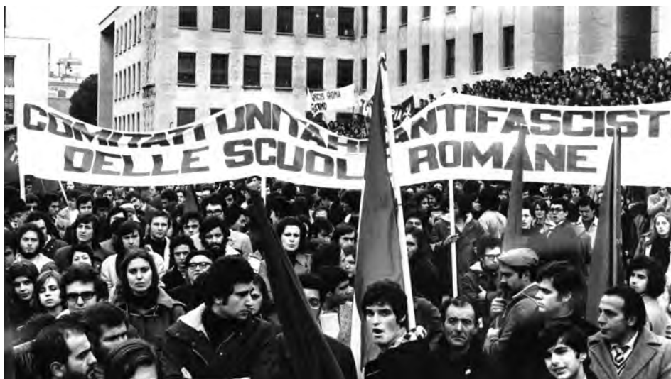
Manifestazione antifascista all'Università La Sapienza di Roma, Roma, 18 gen. 1973