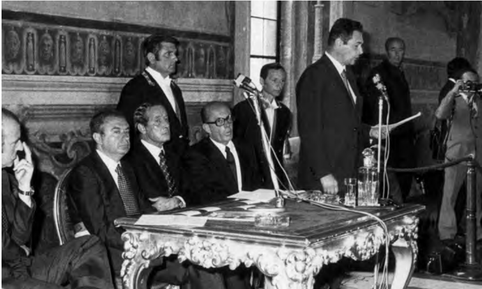
Celebrazione in Campidoglio. XXX Anniversario Cgil, Roma, 3 giu. 1974