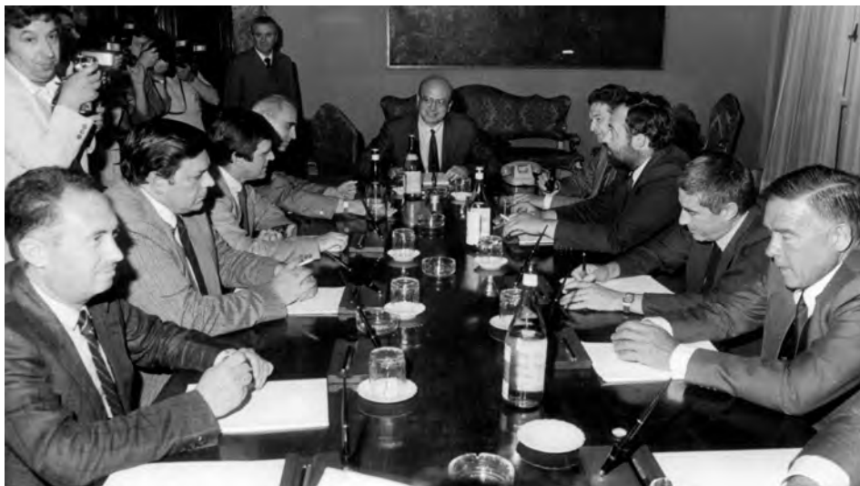
Trattative tra Governo e sindacati. Al tavolo siedono, tra gli altri, Lettieri, Benvenuto, Carniti, Craxi, Lama, Del Turco, Marini e Trentin, Roma 1984