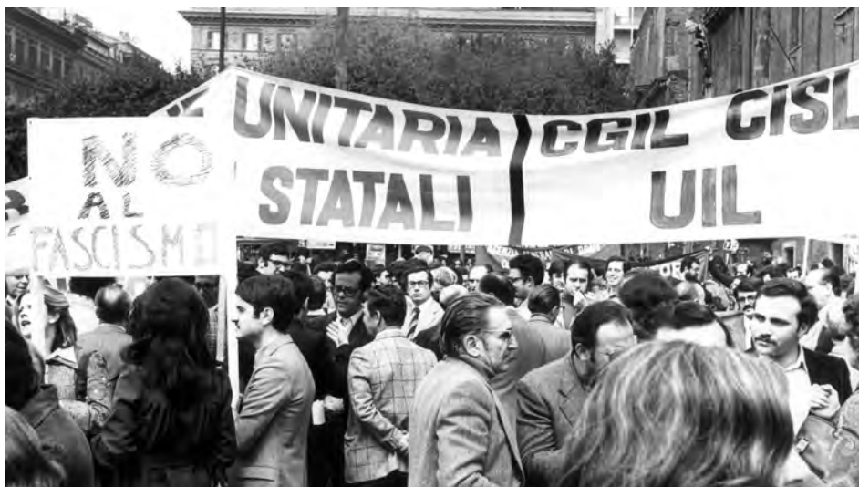
Manifestazione dei dipendenti statali, Roma 1976