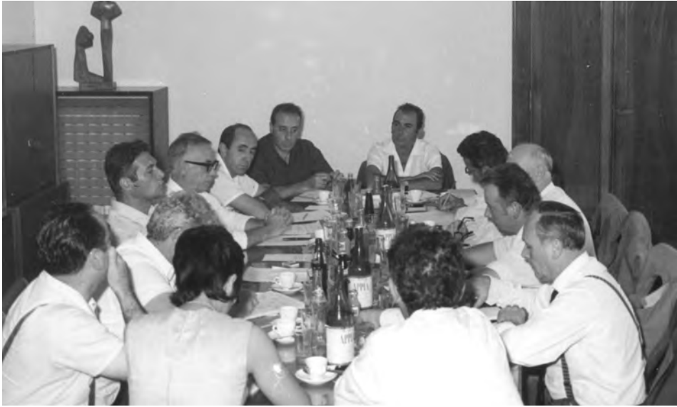
Incontro nella sede nazionale della Cgil con la delegazione della Cgt, set. 1970