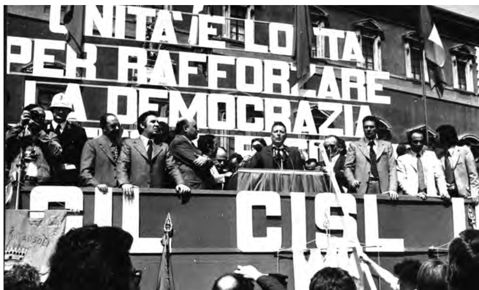
Sciopero generale indetto dai sindacati contro la strage di Brescia, Roma, 29 mag. 1974