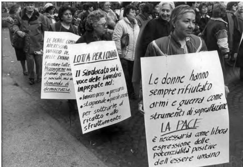
Manifestazione sul lavoro femminile, Napoli 1986