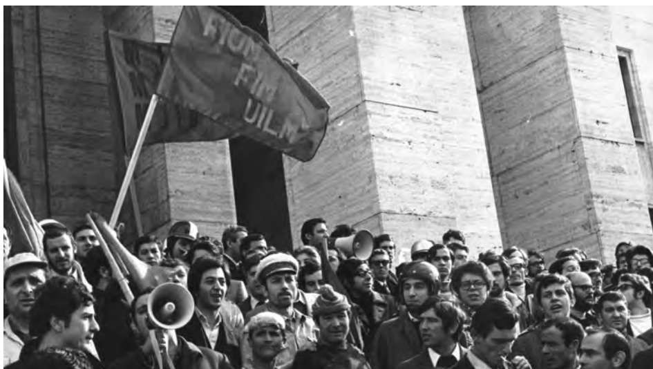
Studenti e operai in corteo, Roma, 6 feb. 1970